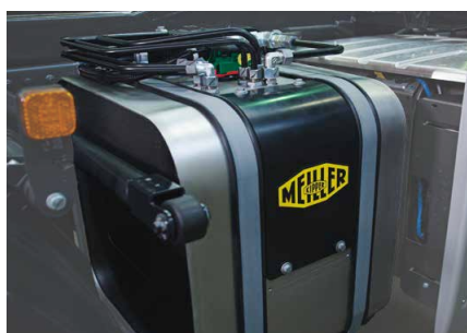
Alles aus einem Tank: Mehrere Verbraucher (Kipper, Kran & Kommunalhydraulik) können aus einem MEILLER Kompakttank versorgt werden.