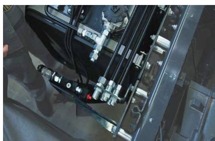
Dauerhaft vor Korrosion geschützt: Kunststoffbeschichtete Stahlleitungen.